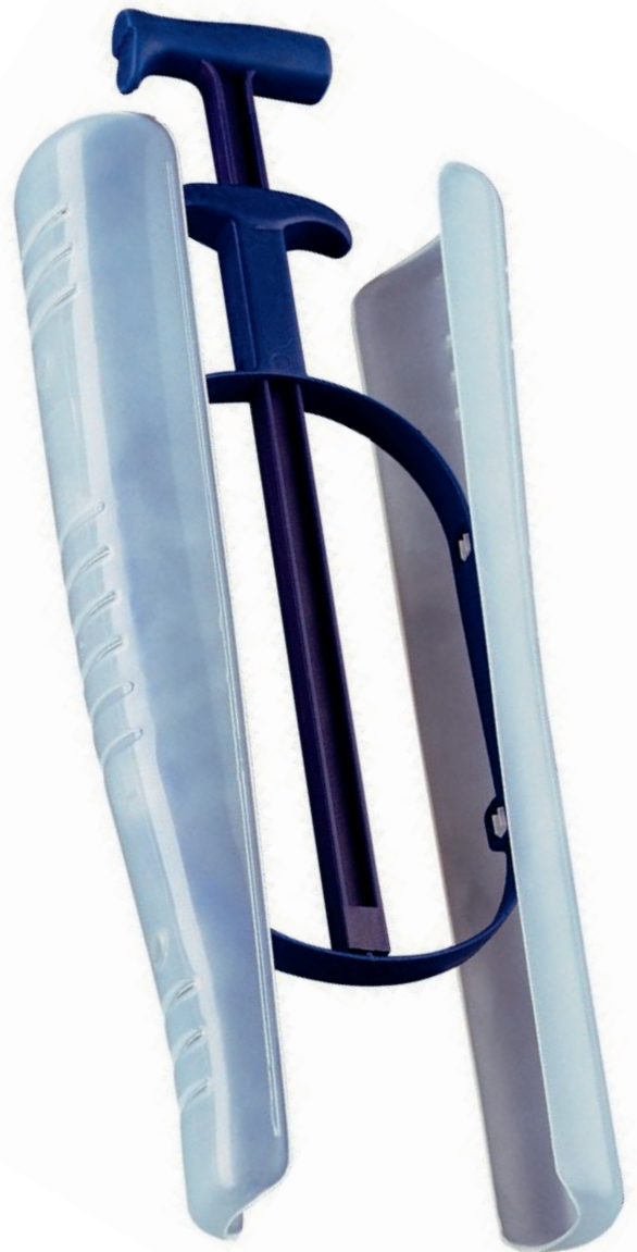
Art.-Nr. / Item No: 9-4710 Größe / Size: 32 cm / 37 cm

Exclusive boot former with insertion mechanism. Can be stored hanging or standing. Takes the form of the leg of the boot. Allows for air circulation in boot and thus ensures optimal drying.