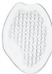
Art.-Nr./Item No: 8-334001 Größe/Size: Onesize

Die rutschfesten, durchsichtigen Gel- Halbsohlen polstern den Fuß beim Gehen und Stehen und geben ihm perfekten Halt im Schuh. Das zehenfreie „Easy Step“ gibt in spitzen Schuhen mehr Raum. Ideal auch für offene oder hohe Damenschuhe sowie zum Größen- ausgleich.