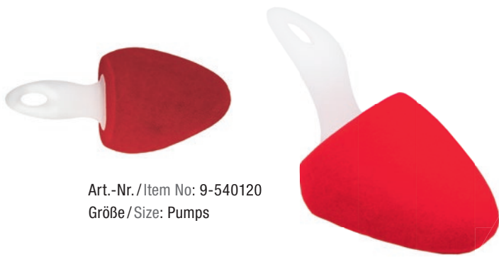
Art.-Nr. / Item No: 9-540120 Größe / Size: Pumps

Biocidal SILVERPLUS® finish uses the effect of silver chloride for additional hygiene and freshness by inhibiting the formation of odour-causing bacteria. Certified according to Oeko-Tex 100 Standard, Cat. IV. Paired in environmentally friendly cardboard packaging.