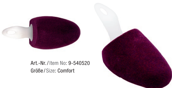
Art.-Nr. / Item No: 9-540520 Größe / Size: Comfort