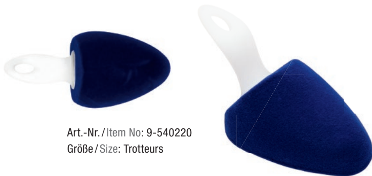
Art.-Nr. / Item No: 9-540220 Größe / Size: Trotteurs