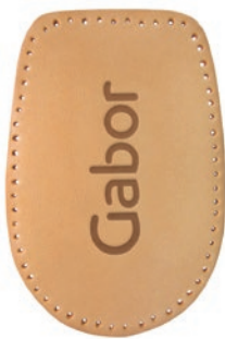
Art.-Nr./Item No: 8-3365 Größe/Size: 1 - 4

Fersenkissen mit echter Lederdecke, pflanzlich gegerbt und selbstklebend. Gibt der Ferse weiche Unterstützung und dämpft den Auftritt. Auch als Erhöhung geeignet, wenn der Schaft drückt.